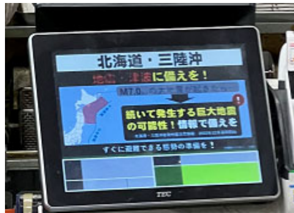
従業員や施設利用者への情報伝達