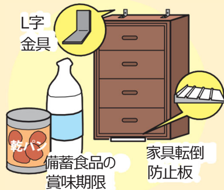
日頃からの地震への備えの再確認