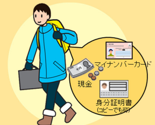
非常持出品の常時携帯