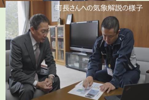
町長さんへの気象解説の様子