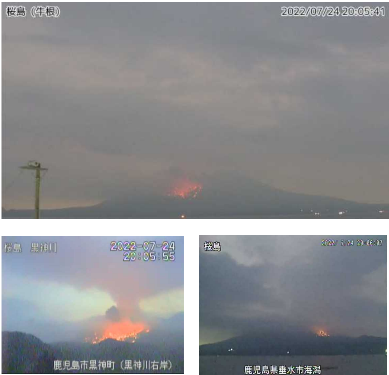
図2 桜島 7月24日20時05分の南岳山頂火口の噴火の状況 (監視カメラ)