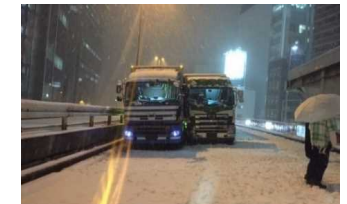
首都高3号渋谷線の状況 <平成30年1月22日 20時頃>