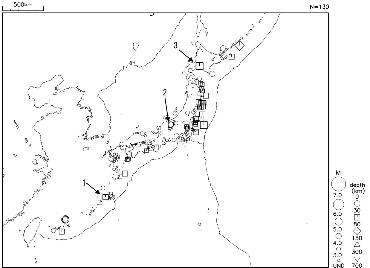
平成 31 年 2 月に震度 1 以上を観測した地震（図中の番号は、表の番号に対応）