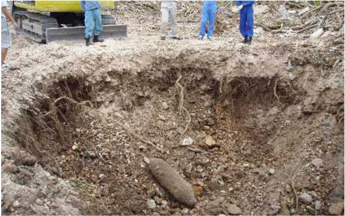
不発弾発見時の写真