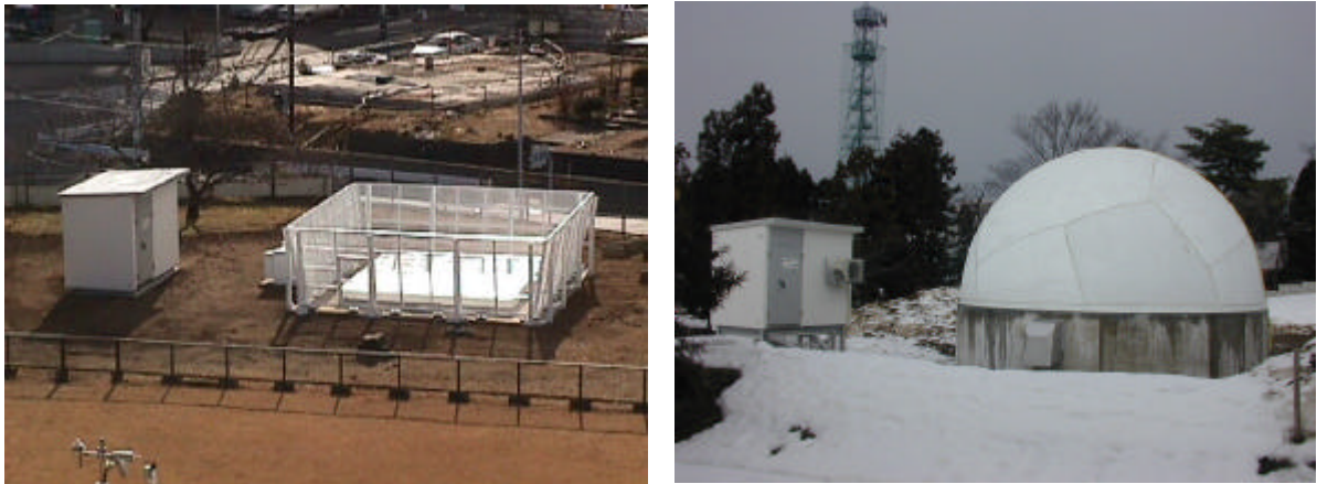
図1 設置されたウィンドプロファイラ (左：水戸地方気象台、右：高田測候所)