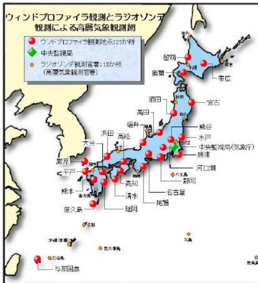
図2 ウィンドプロファイラとラジオゾンデによる高層気象観測網