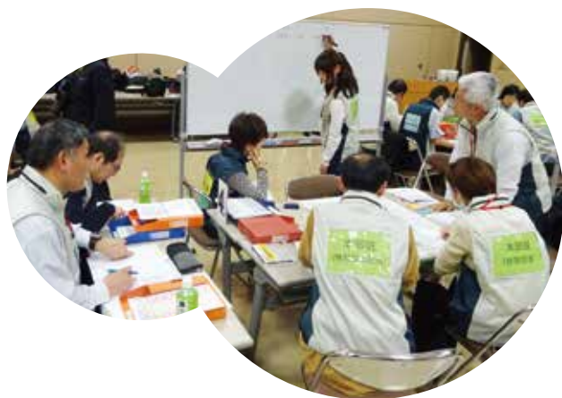
気象防災アドバイザー育成研修において、市町村の防災対応の流れを学習する受講生

平成28年度に実施した「地方公共団体の防災対策支援のための気象予報士活用モデル事業」※2において、地方公共団体の防災の現場で気象の専門家が防災気象情報の解説を行うことや、地方公共団体の防災担当者向けの防災気象情報の普及啓発の取り組みを行うことが、適切な防災対応につながる事が確認されています。