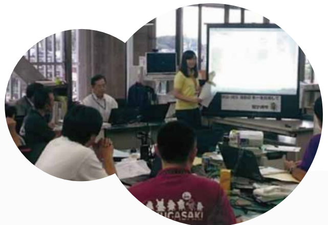
気象防災アドバイザー(写真奥 右から2番目)の指導の下、気象を解説する市職員