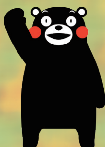
熊本県 PRキャラクター 「くまもん」 ©2010 熊本県くまモン