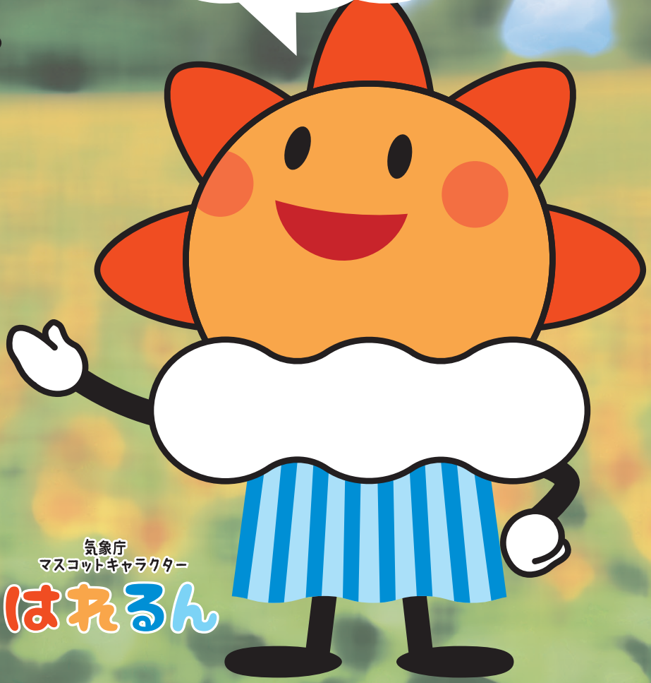
気象庁 マスコットキャラクター はれるん