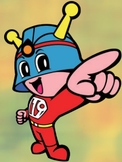
東京消防庁 マスコットキャラクター 「キュータ」