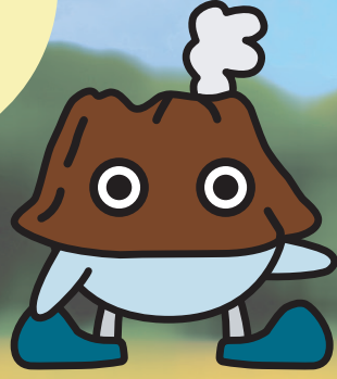
気象庁火山防災 マスコットキャラクター ぼるけん

かいさいにちじ 開催日時 れいわねん 令和8年 がつにちすい 7月29日(水)・30日(木) にちもく 9時～16時