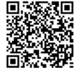
危険度分布 (土砂災害)

今後、発表する警報、注意報、竜巻注意情報、気象情報に留意し、最新の情報を活用してください。今後、市町村からの防災に係る情報に留意してください。また、台風の進路、土砂災害や浸水害及び洪水の危険度に関しては「気象庁ホームページ」などを確認してください。