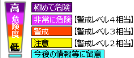
洪水警報の危険度分布