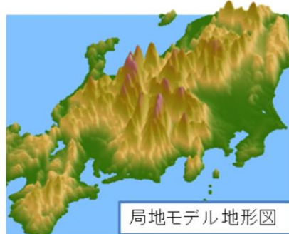
局地モデル地形図

図に、全球・メソ・局地モデルの予測計算領域と、各モデルにおける地形を示す。メソモデルと局地モデルは共に領域モデルであるが計算領域が異なっており、局地モデルはより日本付近へと領域を絞っている。領域を絞ることで計算量を抑え、水平格子間隔2kmという分解能を実現している。また、全球モデルとメソ・局地モデルは、それぞれの水平格子間隔に応じてモデルで表現される地形が異なる。局地モデルのモデル地形は、メソモデルと比べても精緻である。