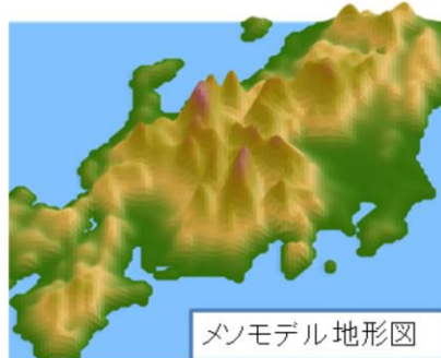
メソモデル地形図