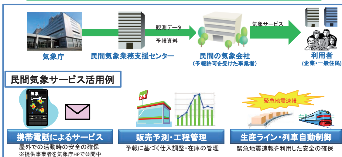
気象庁からの観測データ、予報資料の流れと、民間気象事業者による気象サービスの例

気象庁から提供された観測・解析・予報等の成果及び数値予報資料を基盤として、民間気象事業者は様々な気象サービスを行っています。