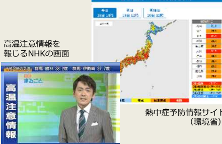
高温注意情報を報じるNHKの画面